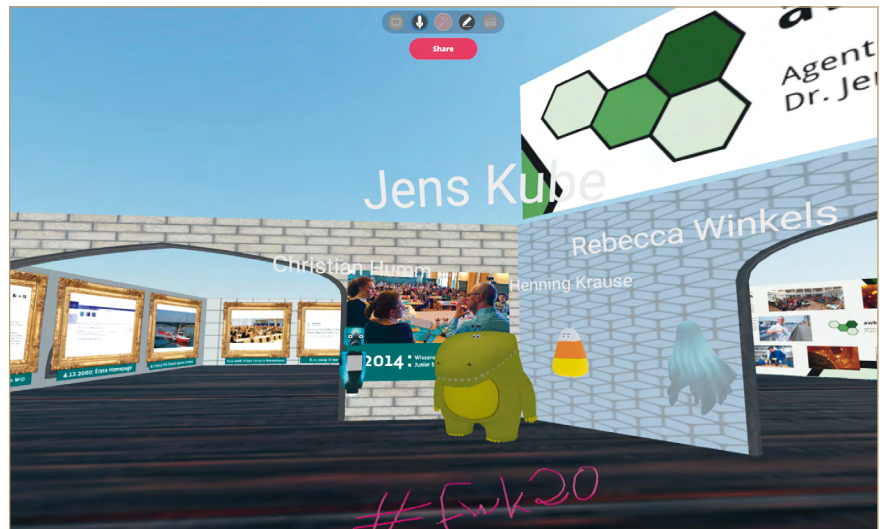
Abb. 1: Digitales Networking und Austausch auf Konferenzen in Zeiten der Covid-19-Pandemie ist, wenn sich ein Roboter mit einem Krokodil vor dessen virtuellen Stand unterhält.

Durch das Schwerpunktthema des Forums drängt sich mir mehr als zuvor schon die Frage nach den Gemeinsamkeiten und der künftigen Entwicklung der beiden Felder Wissenschaftskommunikation und Technikfolgenabschätzung auf. Sicher liegt der Fokus bei ersterem eher auf (massen-)medialen Phänomenen, den Kommunikationsprozessen und Formaten – in der Technikfolgenabschätzung eher auf den wissenschaftlichen Themen und ihren sozialwissenschaftlichen und philosophischen Implikationen, den (institutionalisierten) Beratungssettings oder kleineren deliberativen Teilöffentlichkeiten. Beide eint aber, dass sie sowohl Praktiken als auch Forschung sind und dass sie keine Dis-